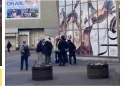
集団で固まって立ち話

とりあえず気になっている3つの事例を紹介したが、このフリーペーパーで書いても当事者たちには届かないだろう。それでも「人の振り見て我が振り直せ」の諺通り、自分から正しいこと、今回上げた事例を見つけたら、じーっと見つめて「何やってるの?」という視線を向けて簡単な抗議を示すのも良いだろう。もしかすると改善されるかも?