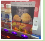
売ってる焼き手巾

一時期はドラッグストアも同様に少なかったが観光客需要で増えたので、こちらは現時点で困ることはない。