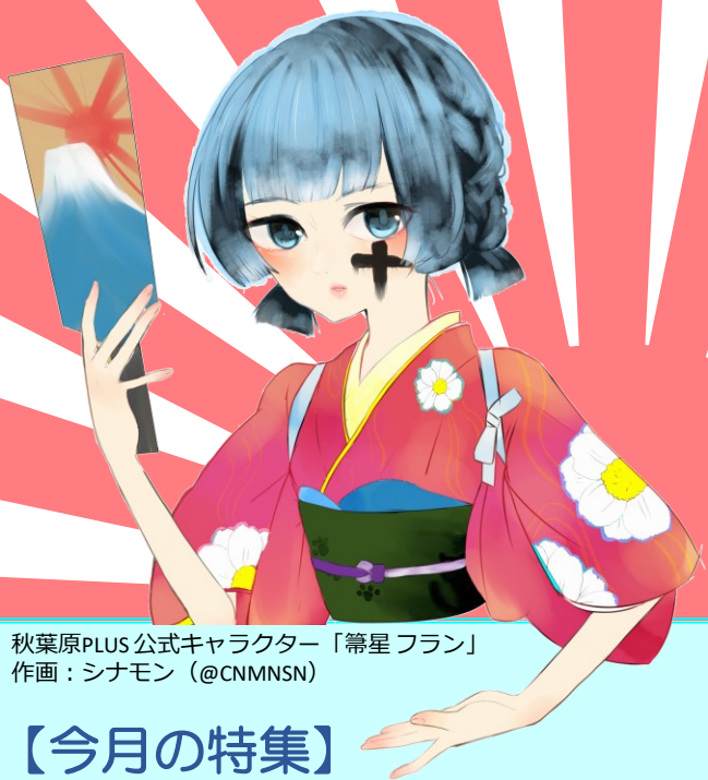
秋葉原PLUS公式キャラクター「笈星 フラン」 作画：シナモン (@CNMNSN)