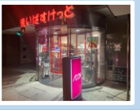
実はスーパーも少なくても特売品を狙うのは難しい...